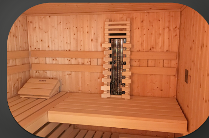
INFRAROT & SAUNA